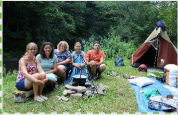
Kamperen in de bergen

Met het team zijn we 2 nachten wezen kamperen tussen de bergen op een mooi plekje aan de rivier. Het was heerlijk om er even uit te zijn en te genieten van het mooie landschap. Het waren gezellige dagen samen met het team.