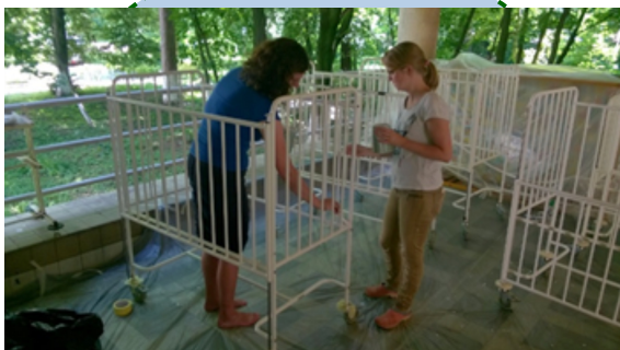
Verven van de kinderbedjes